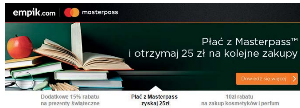
Ilustracja 6. Banner z empik.com z dnia 04.11.2016

kondycję człowieka. Wynika z tego, że również w przypadku tego baniera można uznać, że oferując produkty, sklep w istocie zachęca do zakupu stylu życia.