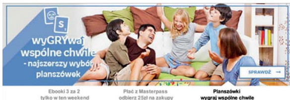
Ilustracja 3. Banner trzeci empi.com z dnia 25.10.2016

W zależności od umiejscowienia, bannery wydają się pełnić różne funkcje i prezentować informacje w odmienny sposób. W analizowanym okresie zmianie ulegały bannery pierwszy oraz trzeci, natomiast drugi, prezentujący usługi powiązane, pozostawał niezmienny 8 . Różnica polegała na wymowie poszczególnych „ofert promocyjnych”, o czym świadczyła kolorystyka i kompozycja treści. Na pierwszym planie znajdują się przeważnie bannery przykuwające uwagę potencjalnego klienta, jednak ich barwy oraz układ graficzny zależne są od prezentowanych produktów. Bannery podstawowe (ilustr. 1. i 2.) sprawiają wrażenie dynamicznych, dominują na nich żywe barwy a kolory są ciepłe i przykuwające wzrok (czerwień, pomarańcz, żółty). Ilustracje 3. oraz 4. przedstawiają bannery umieszczane na slajderze jako trzecie, aktywowane kliknięciem, a zatem wymagające intencjonalnej działalności internauty. Na obu widoczne są stonowane i spokojniejsze kolory (nawet poduszki na ilustracji 3. nie mają żywych odcieni),