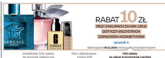
Ilustracja 4. Banner trzeci empi.com z dnia 02.11.2016

pomimo iż oba bannery promują odmienne produkty – w jednym przypadku są to gry planszowe, a zatem aktywność grupowa (w domyśle: rodzinna), w drugim natomiast – perfumy przywołujące na myśl spokój, dobry gust, elegancję i luksus. Pomimo tak odmiennej tematyki uwidoczniły się zatem podobieństwa.