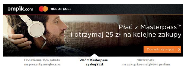
Ilustracja 5. Banner na empik.com z dnia 25.10.2016

Podobne skojarzenie wywołuje banner promujący usługi powiązane, a zatem kupno z wykorzystaniem Masterpass™ oraz nagrodę w postaci bonu na kolejne zakupy (ilustracja 5.).